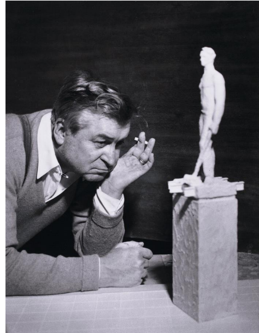
Reino Loppinen: Wäinö Aaltonen, 1954. SVM D1982:20/7

Oikeudenomistaja voi myös luovuttaa aineiston museolle täysin oikeuksin – korvausta vastaan tai korvauksetta